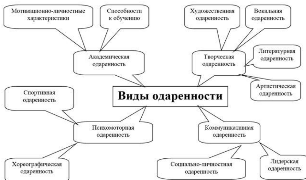
Схема №1. «Виды одаренности в зависимости от вида предпочитаемой деятельности»

Более подробно виды одаренности в зависимости от вида предпочитаемой деятельности показаны на схеме №1 и в таблице 2.